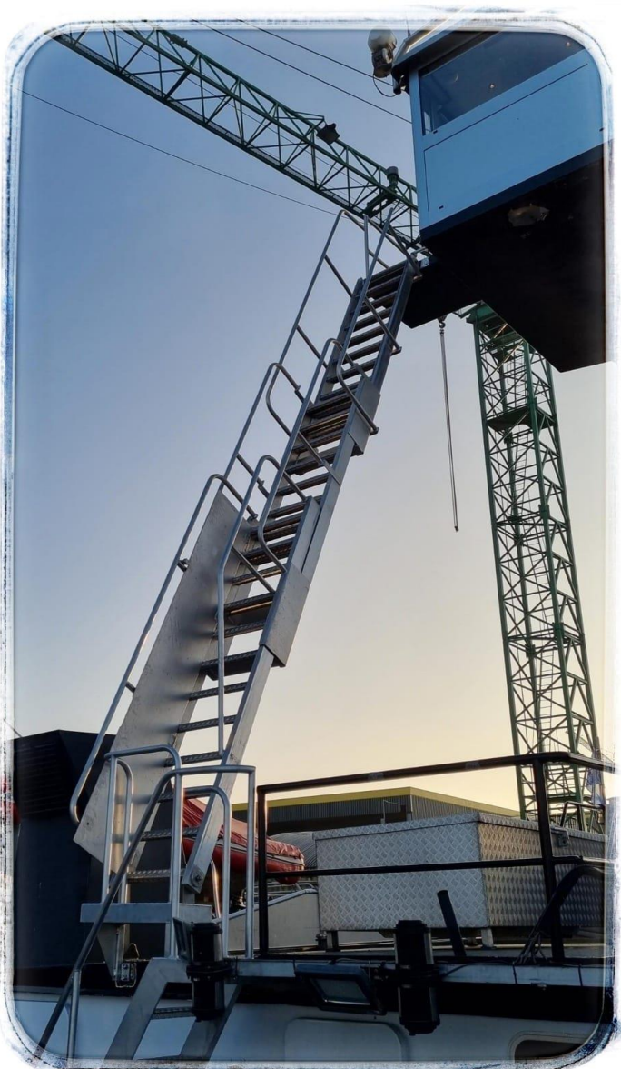
Versie uitschuifbaar met opstapplateau en teruglopende leuningen

Er is ook een variant verkrijgbaar die uitschuifbaar is. Het gebruik van deze stuurhuistrap vereist wel de nodige veiligheidsvoorzieningen.